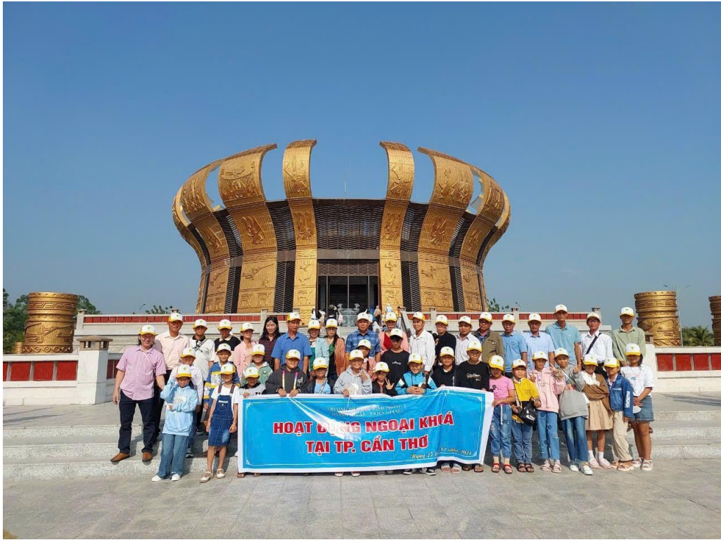
ĐỀN VUA HÙNG CẦN THƠ